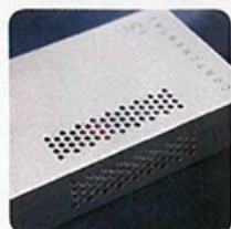
當熄滅藍燈後，可看到橙色顯示燈，表示已可正常使用。