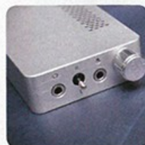
機頂設有 3.5mm 音頻輸入及輸出端子，另配備達 ±10dB 的增益功能鍵。