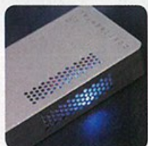
開機後有藍色指示燈，表示真空管正在暖機。

不過膽耳擴向來給予用戶「燙手」的印象，而 Continental v5 就大幅減低了真空管的熱量。記者連續使用 1 小時，機身溫度也不會很熱，值得一讚。另外，為加強真空管耐用性，每次開機時機內更特別設有暖機指示藍燈，約 1 分鐘藍燈熄滅後便可使用，功能相當貼心。③