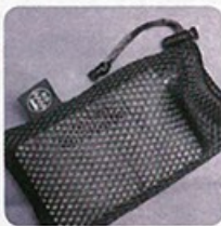
附送的 ALO 收納袋只能容納 Continental v5。