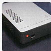
機背設有 MicroUSB 充電，充電 4 小時可連續使用約 7 至 9 小時。